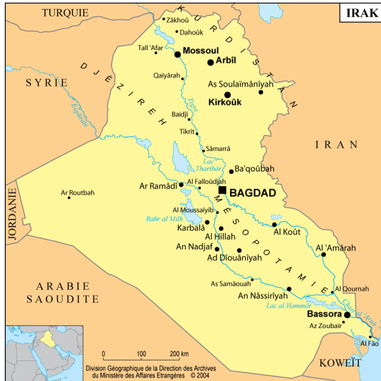
L'Irak et les pays voisins