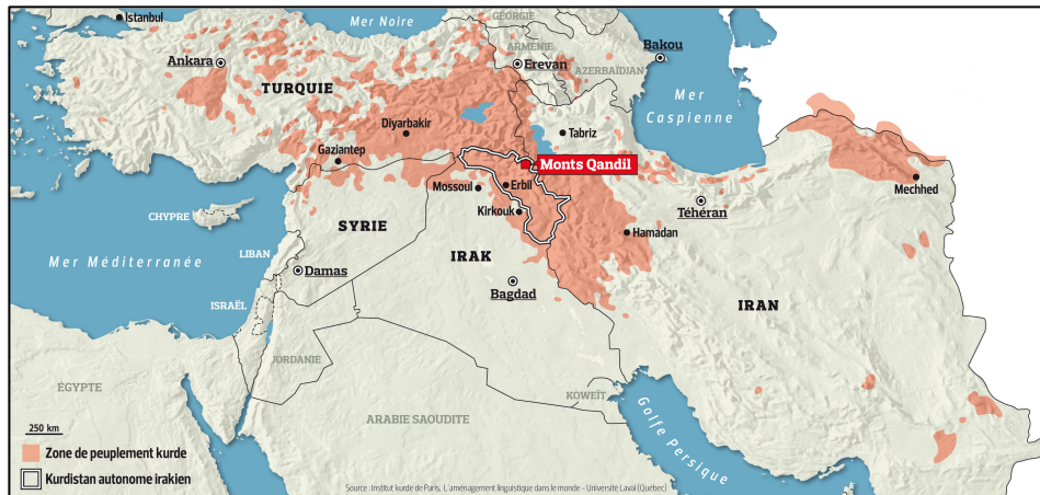
Le kurdistan, entre l'Irak, la Syrie, l'Iran et la Turquie